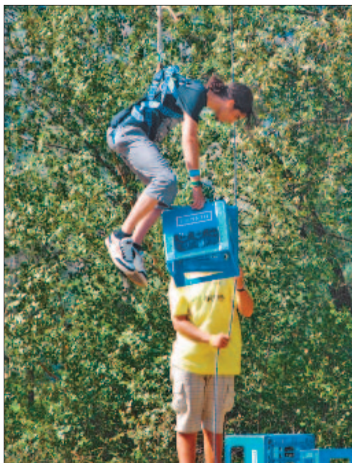
Die Kids stapelten nicht tief, sondern die Harassen hoch.