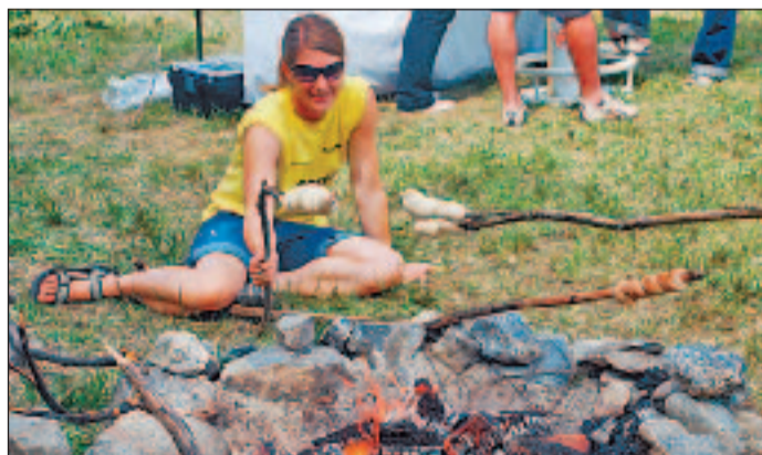
Und zwischendurch eine feine Grillade...

«Leider konnte ich erst vor einer halben Stunde kommen, ohnehin finde ich die Stimmung super, auch das Wetter macht prima mit. Ich konnte aber nicht bei den Spielen dabei sein, da ich hier in der Bierbar arbeiten muss. Ich hoffe auf noch mehr Leute, die bestimmt noch kommen werden. Ich finde es eine gute Sache, dass es auch hier im Wallis einen so grossen Jugendtag gibt.»