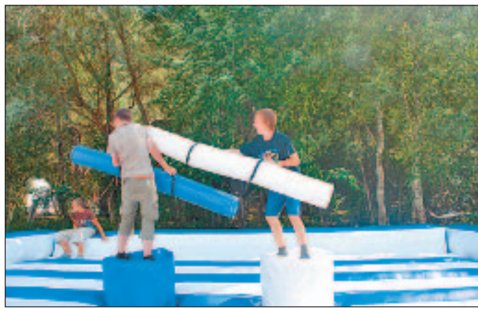
Draufhauen und den Gegner auf die Matte legen.

Da ich der Gitarrist von Bzar bin, konnte ich die grosse Musikanlage hautnah erleben, von der ich sehr beeindruckt bin. Ich bin auch ein Fan von «Stiftl», auf deren Konzert ich mich schon freue.»