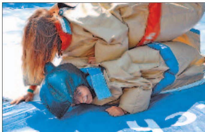
Beim Sumoringen blieb kein Auge trocken.