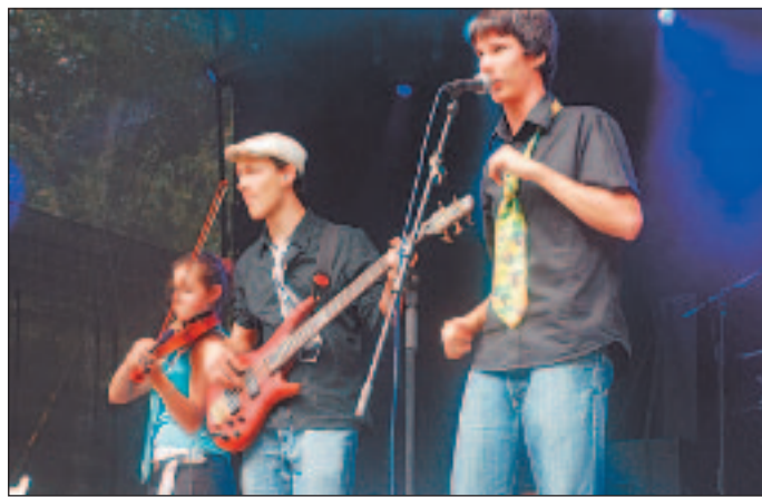
«Kabellos» rockten tüchtig ab.