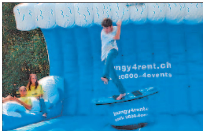
Hoppla! Gar nicht so leicht, die Balance zu halten.

Ich freue mich schon riesig auf das Konzert von Stefanie Heinzmann, da ich ein grosser Fan von ihr bin.»