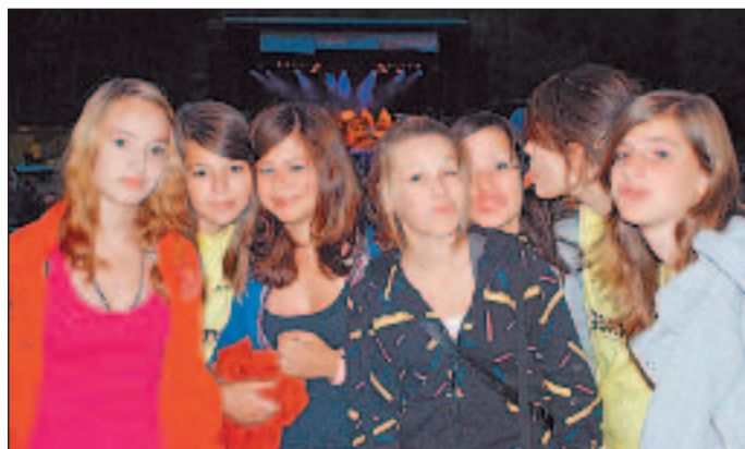
Ausgelassene Stimmung am Jugendtag.