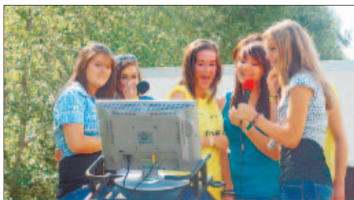
Spass beim Karaoke-singen. Wer traf die Töne richtig?

«Ich bin mit der Jubla Zermatt hier und ich finde es eine gelungene Veranstaltung. Ich arbeite beim Spiel «Gegenstände merken», in dem die Jugendlichen ihren Spass haben. Es hat für jeden etwas, für den einen ist das Sumoringen das Highlight, für den anderen die tollen Bands, die spielen. Das Wetter und die Anlage sind einfach super. Gekommen bin ich mit meinem Kollegen «Truffi» und mit meiner Cousine.»