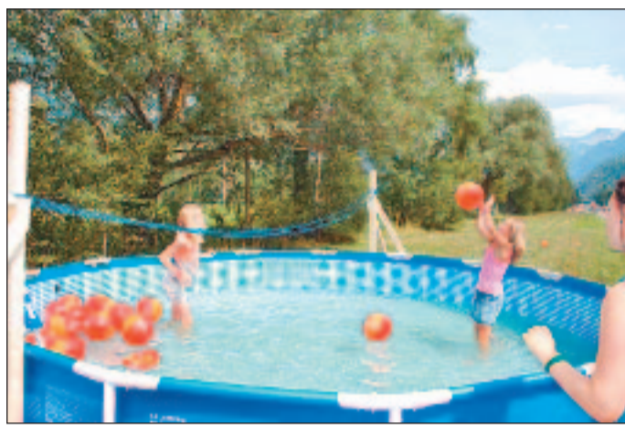
Wasser-Volleyball: Bei der Hitze eine super Idee.